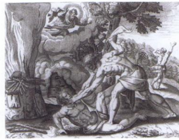
4 Petrus Cool, naar een ontwerp van Maarten de Vos, prent met het verhaal van Kaïn en Abel, ca. 1570, Antwerpen

haardstenen gemaakt. De Antwerpse steendrukkers gebruiken een fijne roodbakken-de klei, waardoor hun product zich duidelijk onderscheidt van dat van de Luikse producenten. De belangrijkste verschillen zijn de rode kleur van de stenen, de smalle omlijsting rond de voorstelling en de betere kwaliteit van de decoraties (scherper). Waarschijnlijk zijn haardstenen op meer plaatsen vervaardigd, onder meer in de Noordelijke Nederlanden. In ieder geval moeten er na de val van Antwerpen in 1585,