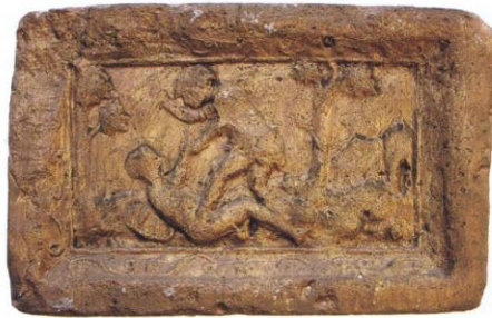
3 Haardsteen met het verhaal van Kaïn en Abel, ca. 1570, Luik