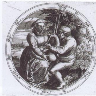
9 ————— Haardsteen met een voorstelling van een vrijend paar, 1550-1600, Antwerpen