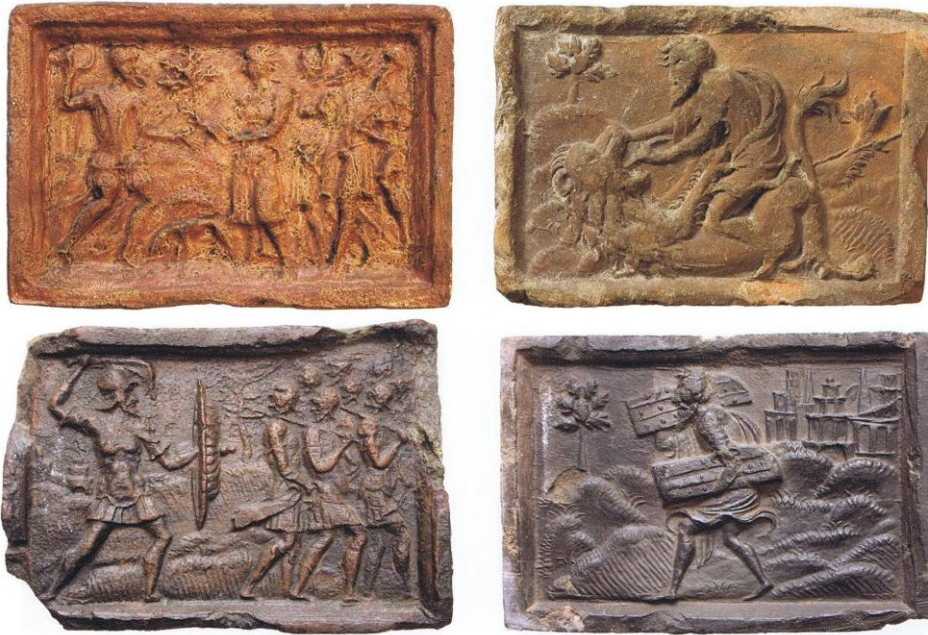
20 ————— De ontmoeting van Abraham met koning Melchisedek, 1550-1600, Antwerpen