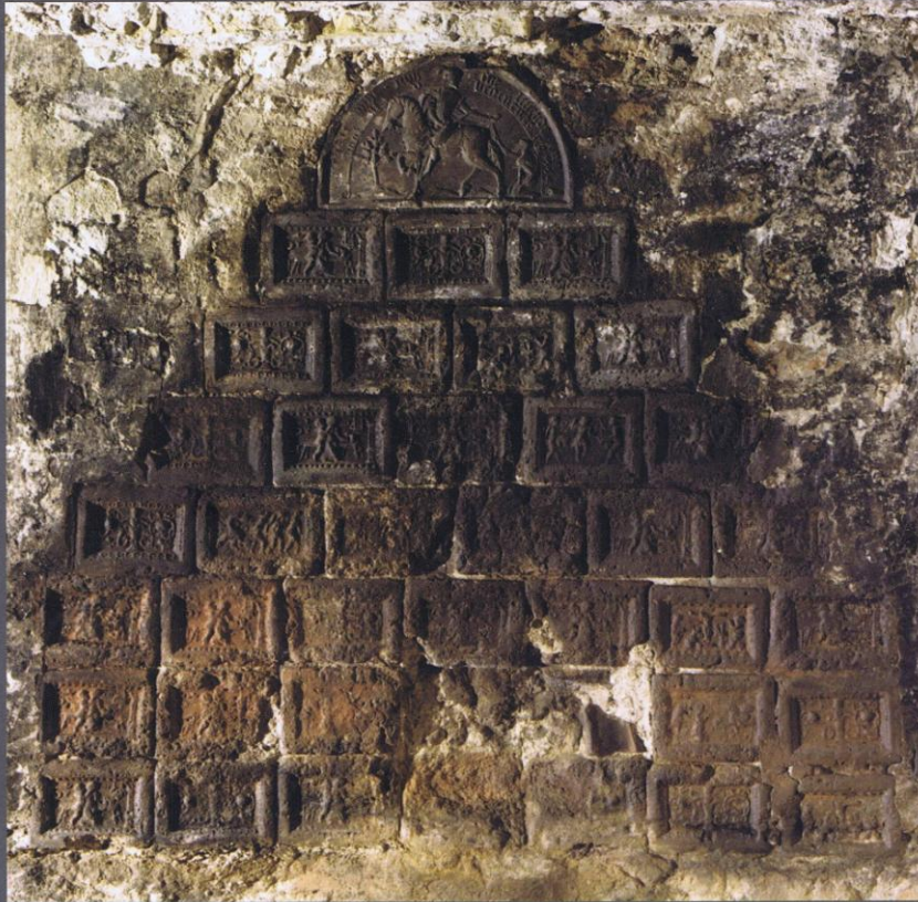
1 Een 16e-eeuwse groep haardstenen in de haard van een huis in de Utrechtse binnenstad.

Minne Iedes Nieuwhof en Frans Laurentius